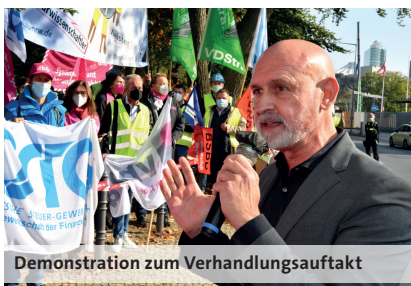
Demonstration zum Verhandlungsauftritt