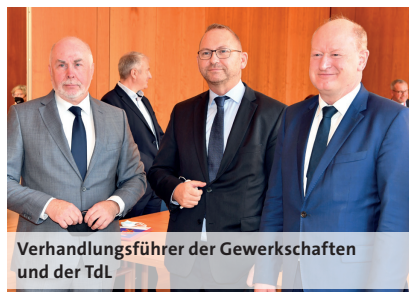
Verhandlungsführer der Gewerkschaften und der TdL