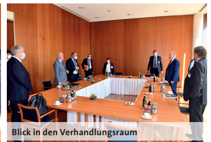
Blick in den Verhandlungsraum