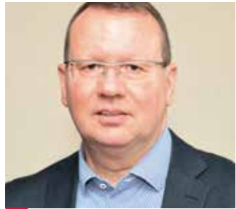
Die Jugend Sachsen-Anhalts verstärkt im öffentlichen Dienst integrieren

starke Verwaltung mit einem leistungsorientierten Dienstrecht, den Erhalt von Tarifautonomie und Flächentarifvertrag, einen modernen Föderalismus und leistungsbezogene Bezahlung für gute Arbeit. Das ist meine klare Ausrichtung für diese Legislaturperiode.“