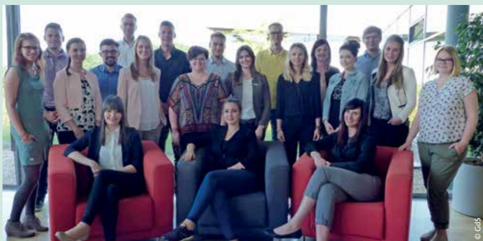
> Die JAVen bei der AOK Plus

und Auszubildendenvertretung (HJAV) beim SMF sowie in der Bezirksjugend- und Auszubildendenvertretung (BJAV) beim Landesamt für Steuern und Finanzen jeweils die Vorsitzende sowie die Stellvertreter. In der HJAV wurden acht von neun Sitzen und in der BJAV alle neun Sitze gewonnen. Allen JAVen wünschen wir viel Erfolg in der Arbeit und immer ein offenes Ohr für die Auszubildenden. Ihr habt Fragen oder Anregungen zur Arbeit der JAVen, dann meldet Euch bei uns: post@sbb-jugend.de .