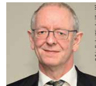
> Mehr Wertschätzung der Beschäftigten des öffentlichen Dienstes

Auf dem Gewerkschaftstag des dbb sachsen-anhalt haben die Delegierten am 25. April 2017 die neue Führungsspitze gewählt. Sie besteht aus dem Landesvorsitzenden, dem Ersten Stellvertretenden Landesvorsitzenden und weiteren vier stellvertretenden Landesvorsitzenden. Neu in der Landesleitung, wie das Gremium laut Satzung heißt, sind die vier Stellvertreter, darunter erstmalig eine Frau. Das dbb regionalmagazin stellt die Führungsriege vor und fragt: „Was wollen Sie für die dbb Mitglieder in den nächsten fünf Jahren erreichen?“