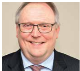
Die Novellierung des Personalvertretungsgesetzes Sachsen-Anhalt hat oberste Priorität.

... geboren am 8. Januar 1963 in Magdeburg, ist seit 1989 im Schuldienst beschäftigt und arbeitet als Diplomlehrer für Biologie und Chemie am Dr.-Carl-Hermann-Gymnasium in Schönebeck. Seine Heimatgewerkschaft ist der Verband Bildung und Erziehung (VBE), deren Mitglied er seit 1990 ist. Seit 2005 ist er Vorsitzender des VBE-Kreisverbandes Schönebeck/Börde, 2005 wurde er erstmals zum stellvertretenden Landesvorsitzenden des VBE Sachsen-Anhalt gewählt. Erfahrungen in der Personalratsarbeit sammelte er seit 1998 als Mitglied im örtlichen Personalrat an seiner Schule, deren Vorsitzender er aktuell ist. Seit 2010 ist er Mitglied des Lehrerhauptpersonalrates beim Ministerium für Bildung. Im dbb sachsen-anhalt ist er seit 2005