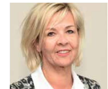
> Gute Kompromisse zwischen Politik, Verwaltung und Personal auch in Zeiten der Digitalisierung finden

Regierung eine deutliche Wertschätzung der Leistungen der Beschäftigten im öffentlichen Dienst nicht nur verbal artikulieren, sondern auch hiernach handeln.“