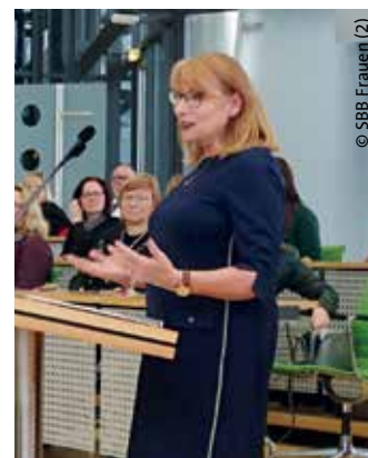
► Die Sächsische Staatsministerin für Gleichstellung und Integration, Petra Köpping, bei ihrer Ansprache.

Frauen stecken in einer Zwickmühle. Denn die Familienplanung und somit die Eltern- und Teilzeit ist im Zeitraum von 25 Jahren bis 40 Jahren auf dem