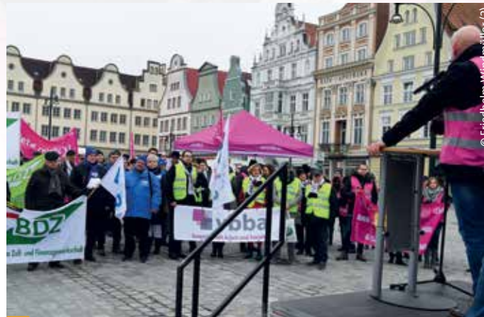
> Zahlreiche Beschäftigte, darunter Mitglieder des BDZ, der kombi, von VAB, vbba und anderen Mitgliedsgewerkschaften des dbb m-v, waren zu einer Kundgebung auf dem Neuen Markt in Rostock zusammengekommen.

vernünftige personelle und materielle Ausstattung, so