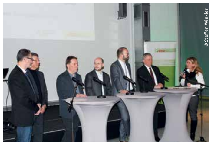
> Die Diskutanten der Fishbowl-Diskussionsrunde, unter anderem mit Kultusminister Christian Piwarz (5. von links).