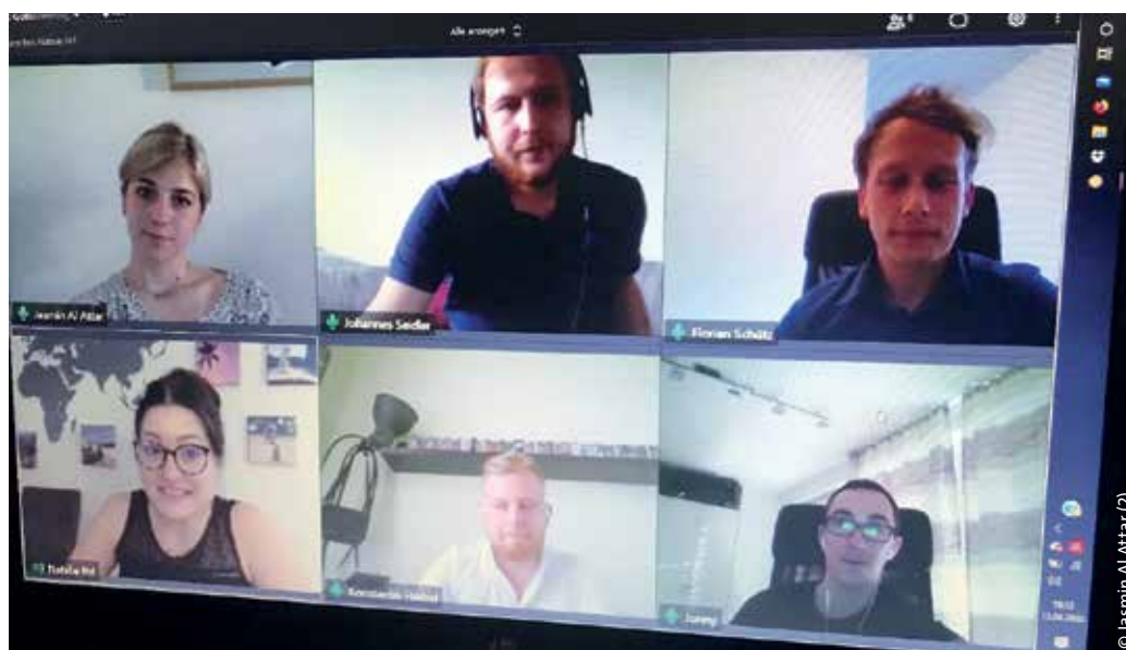
> Im Austausch mit Jugendvertretern der SBB-Familie

ein kühles Getränk in Aussicht gestellt – nach freier Auswahl, aber eben aus dem eigenen Kühlschrank.