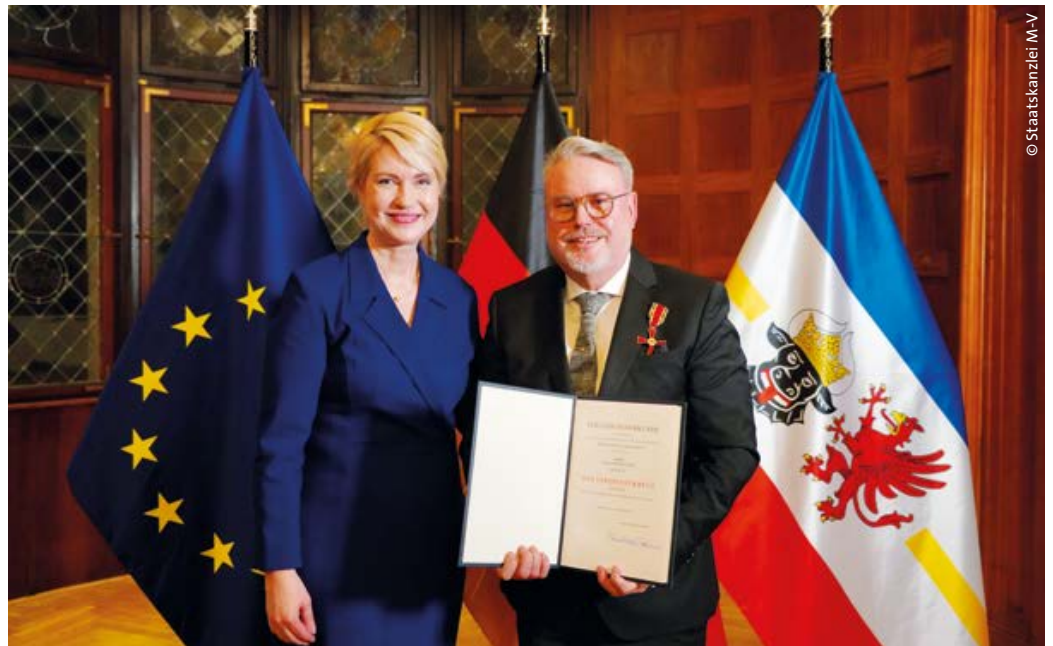
> Ministerpräsidentin Manuela Schwesig mit Klaus-Peter Glimm bei der Verleihung des Bundesverdienstkreuzes am Bande des Verdienstordens der Bundesrepublik Deutschland

Klaus-Peter Glimm habe sich nach der Deutschen Einheit für die rechtliche Anerkennung