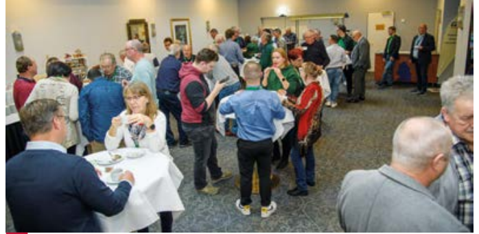
> Die Delegierten und Gäste nutzen die Pausen, um miteinander ins Gespräch zu kommen.

stand beziehungsweise eine frühere Rente zu vernünftigen finanziellen Bedingungen für die Beschäftigten einsetzen möge, die langjährig im unregelmäßigen Schichtdienst arbeiten.