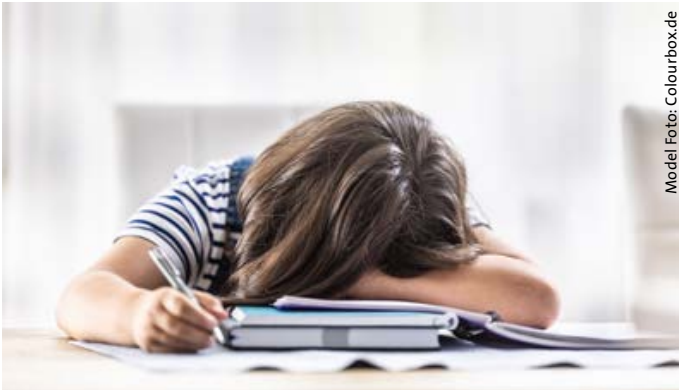
Model Foto: Colourbox.de